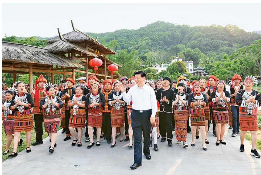
2022年4月10日至13日，中共中央总书记、国家主席、中央军委主席习近平在海南考察。这是11日下午，习近平在五指山市水满乡毛纳村向村民们挥手致意。

要增强国内资源生产保障能力。要加大勘查力度，实施新一轮找矿突破战略行动，提高海洋资源、矿产资源开发保护水平。要明确重要能源资源国内生产自给的战略底线，发挥国有企业支撑托底作用，加快油气等资源先进开采技术开发应用。要加强国家战略物资储备制度建设，在关键时刻发挥保底线的调节作用。要推行垃圾分类和资源化，扩大国内固体废弃物的使用，加快构建废弃物循环利用体系。